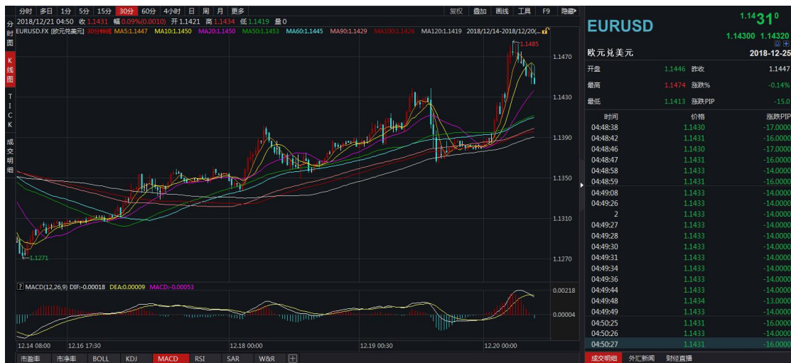
图 3：欧元兑美元走势

欧元兑美元上涨 0.34%，收于 1.1346。本周意大利与欧盟就 2019 年预算达成协议，欧元大幅上涨，周三欧元兑美元盘中最高攀至 1.1440。周中，英国政府全面启动“无协议”脱欧准备工作。