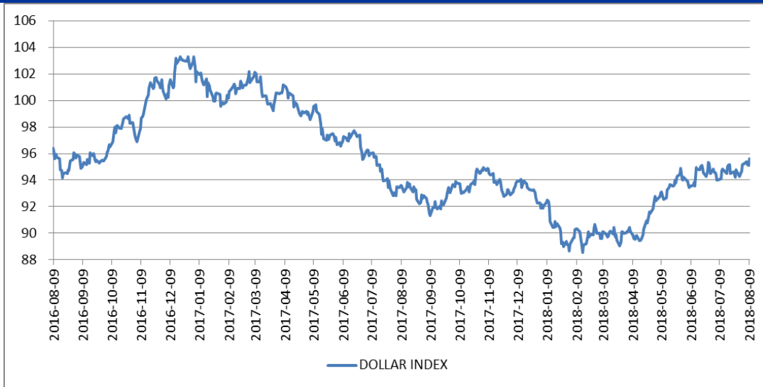
图 2: 美元指数走势

本周欧元继续疲弱，破位 1.15 关键支撑位。本周前段时间，受到美元指数的上涨，欧元承压下行。此后，德国 6 月贸易收支盈余略高于预期，支撑欧元小幅反弹。然而，受到英国脱欧疑虑的影响，欧元再一次大幅下探，并且随着土耳其里拉事件的影响，欧元破位 1.15 重要支撑位。从技术面来看，欧元已进入下跌通道，短期内或将维持跌势。