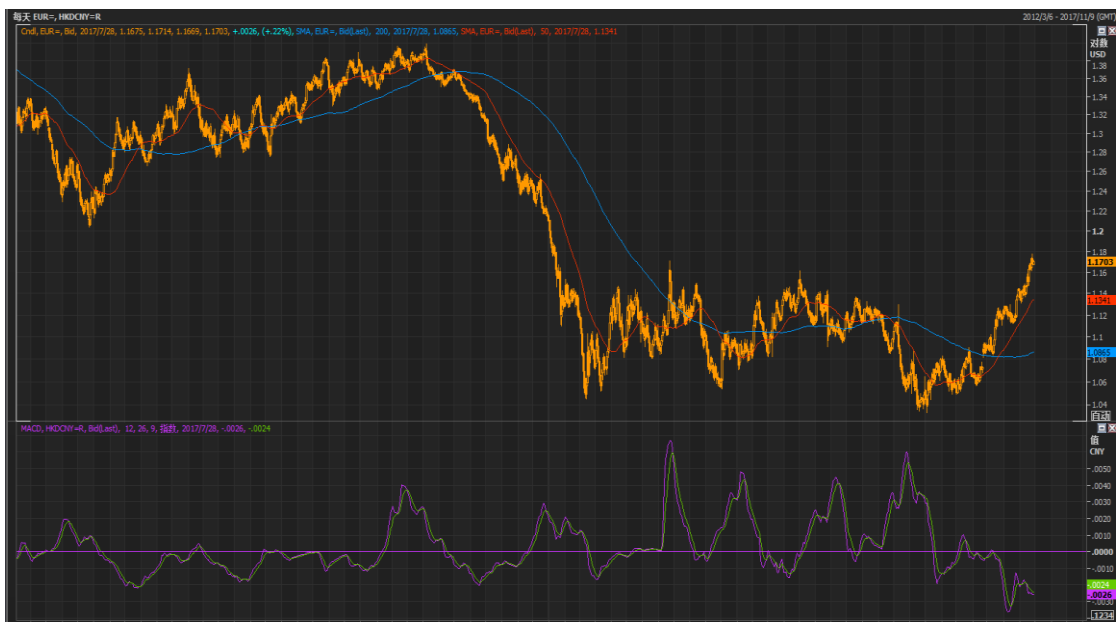
图 3：EUR/USD 走势

欧元方面，美元指数在 13 个月之低位附近徘徊，因美联储对通胀前景发出了更为谨慎措辞，提升了对年内可能不会再加息的预期。美联储并表示将在相对的短期内，开始缩减资产负债表，以及更加明确地指出通胀疲弱，而欧洲央行总裁德拉吉 6 月暗示欧洲央行将调整购债计划以来，市场资金明显流向欧元，欧元周四上升至 1.1777 之两年半高位，但 1.1700 仍为较强压力位。