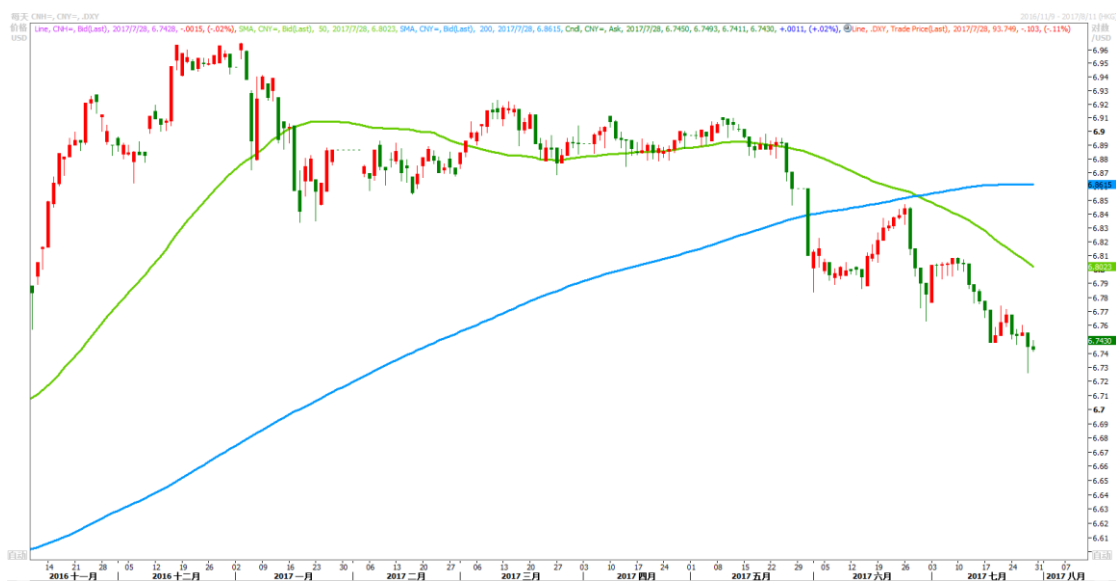
图 1：美元兑人民币即期汇率走势

美元兑人民币掉期市场区间震荡，1年期美元兑人民币掉期维持800点至900点区间。