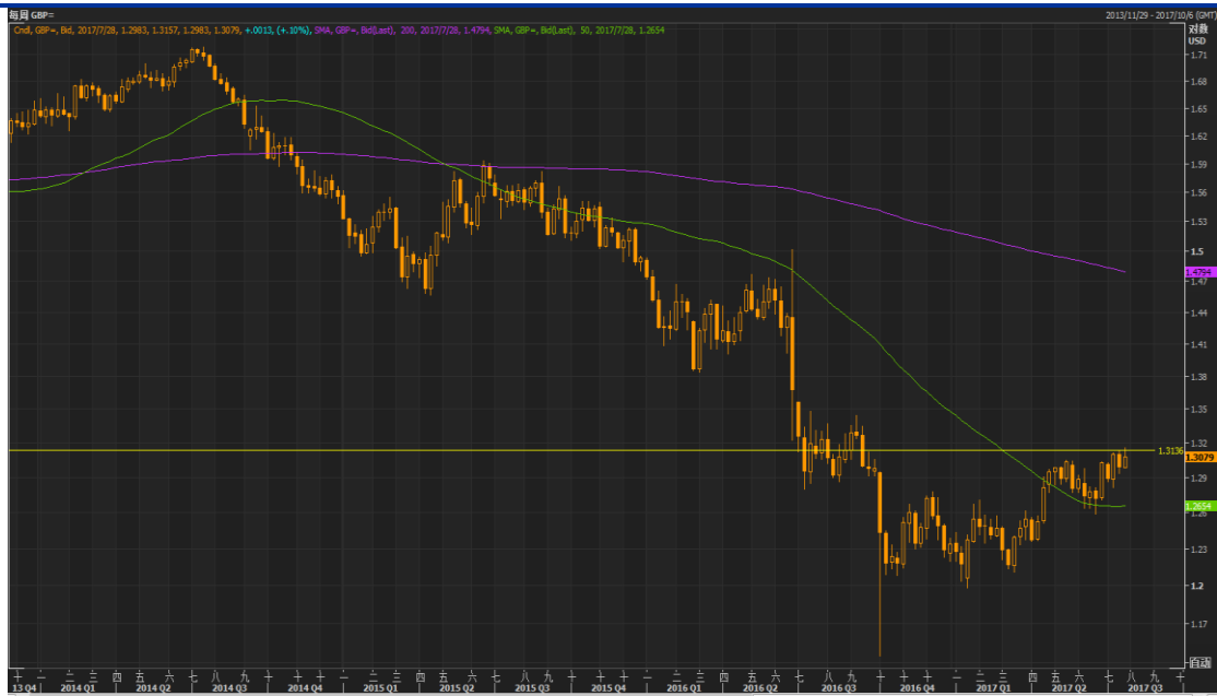
图 4：GBP/USD 走势